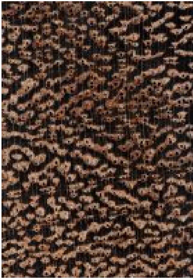
Wacapou ( Vouacapoua americana ) - Querschnitt ca. 10x